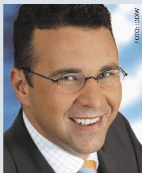
Dr. Joachim Pfeiffer