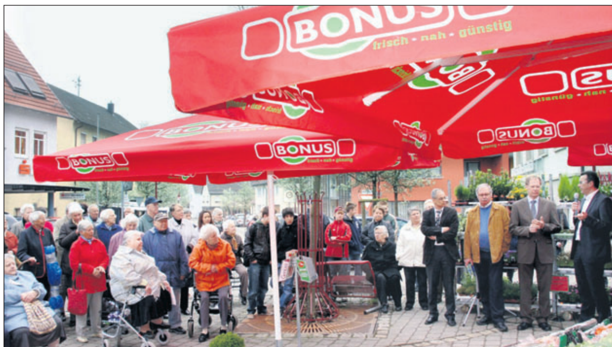
Der Bundestagsabgeordnete Dr. Joachim Pfeiffer (rechts) war prominentester Gast bei der Eröffnung des Bonus-Marktes in Urbach.